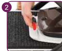
Trek aan hendel om in te klappen