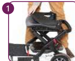
Klap de zitting in