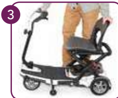
Zitting uitklappen en vergrendelen