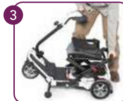
Stuurkolom inklappen en vergrendelen