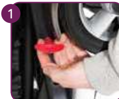
Trek aan hendel