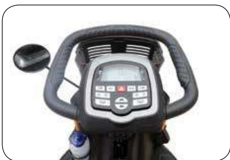
Herontworpen stuur met LCD-console

De Pride® Zolar Scootmobiel biedt de wendbaarheid van een 3-wiel scootmobiel, samen met high-performance kenmerken, zoals volledig instelbare, extra comfortabele vering en een gesloten hydraulisch remsysteem. De Zolar heeft een slanke sportieve stijl en een schat aan standaard luxe met inbegrip van een ergonomisch gevormd stuur voor optimale handgrip en LED-verlichting. Al deze kenmerken maken van de Pride Zolar een ultieme outdoor scootmobiel.