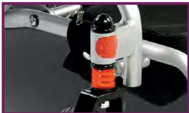
Hi-Torque front suspension

De i-Go™ van Pride heeft een geavanceerde vouw-technologie, zodat hij snel en gemakkelijk kan worden vervoerd. De i-Go heeft vering aan de voorkant, een duurzaam zitsysteem, bergruimte onder de stoel en nog veel meer. Ontworpen om binnen om het even welke kleine ruimte te passen en met een gewicht van slechts 19,8 kilo is de i-Go de perfecte keus voor de actieve individu.