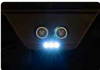
Achteruitrijsensoren met licht